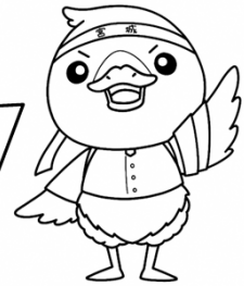
みやぎハローワークキャラクター 「ガンちょーさん」