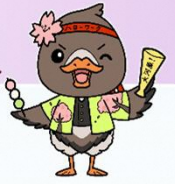
みやぎハローワークキャラクター「ガンちょーさん」