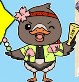
みやぎハローワークキャラクター「ガンちょーさん」