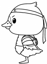
みやぎハローワークキャラクター「ガンちょーさん」