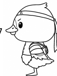
みやぎハローワークキャラクター 「ガンちょーさん」