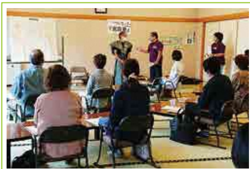
永野地区公民館 「地元を知ろう!! 真田の里矢附を歩く」