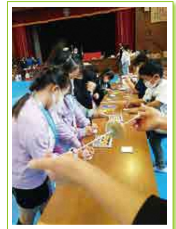
円田地区公民館「昔遊び大会」