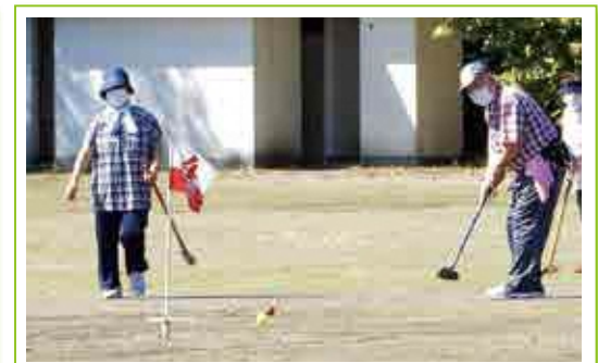
遠刈田地区公民館「グラウンドゴルフ大会」