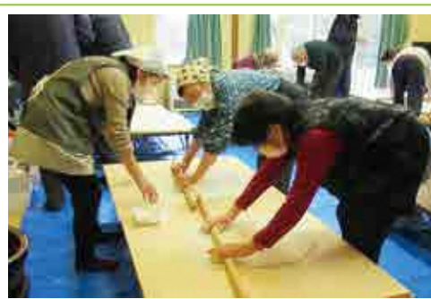
平沢地区公民館「そば打ち体験教室」