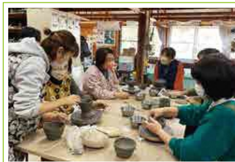
宮地区公民館「陶芸教室」