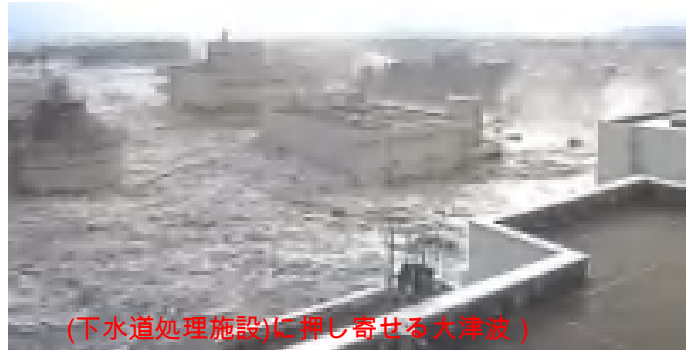
(下水道処理施設)に押し寄せた大津波)