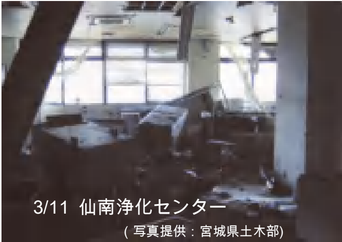
3/11 仙南浄化センター