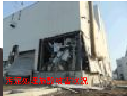
汚泥処理施設被害状況