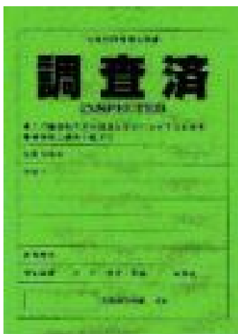
( 緑色 )